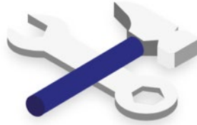
Mise en œuvre